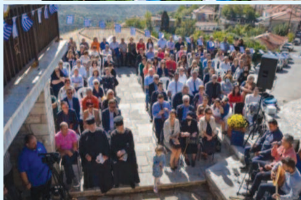
Μερική άποψη του κοινού της εκδήλωσης