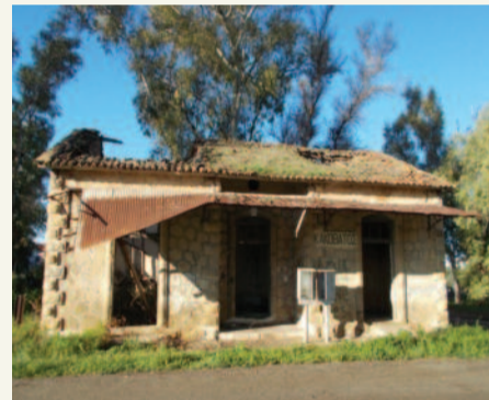
Εικόνες εγκατάλειψης, καταστροφής και ερήμωσης με τεράστιο οικονομικό και κοινωνικό κόστος

Ο Σύλλογος Φίλων Σιδηροδρόμου δεν είχε μείνει αδρανής σε αυτή την υπόθεση. Στις 14 Οκτωβρίου, κατά την διάρκεια διαβούλευσης του νομοσχεδίου, προσκλήθηκε από την διαρκή επιτροπή οικονομικών υποθέσεων της βουλής και εξέθεσε τις τεκμηριωμένες απόψεις του, με αναλυτικές μελέτες και προτάσεις, που έκαναν μεγάλη αίσθηση. (Βλ. περιοδικό «ΣΙΔΗΡΟΤΡΟΧΙΑ» τεύχος 37-38).