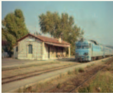
Αριστερά ο σταθμός μας, τότε που έβλεπε τα τρένα, όχι μόνον να περνούν αλλά και να σταματούσαν για τους επιβάτες, και δεξιά η διασταύρωση με το δρόμο προς θάλασσα.

Είχαμε και τον σταθμό μας στο Θολό, όπως μας θυμίζουν οι φωτογραφίες.