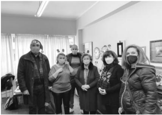
Ένα αντιπροσωπευτικό στιγμιότυπο